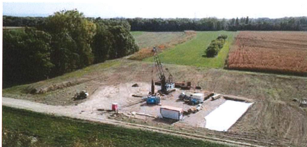
Vue aérienne du site de la future centrale au Parc d'Innovation

Après une période de plusieurs mois qui a consisté à mettre en place les tubes guides assurant la protection des aquifères et à aménager la plateforme de forages, celle-ci est prête à accueillir la tour de forage, appelée « RIG ». Cette machine est un élément central des projets de géothermie profonde. Le montage du RIG et de tous ses équipements périphériques s'étalera sur une quinzaine de jours début juin, puis le forage du premier puits démarrera.